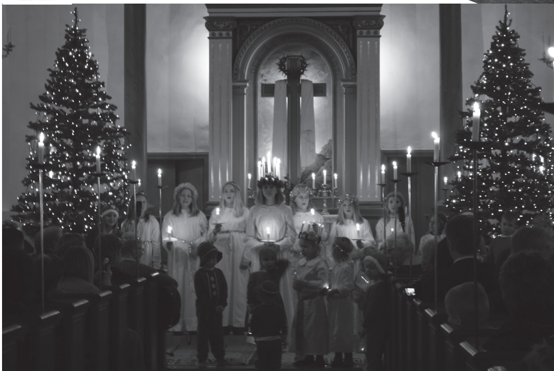
Lucia 2017 sidan 5