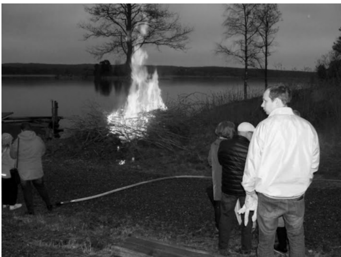
Våreliden tänd vid kyrkans brygga