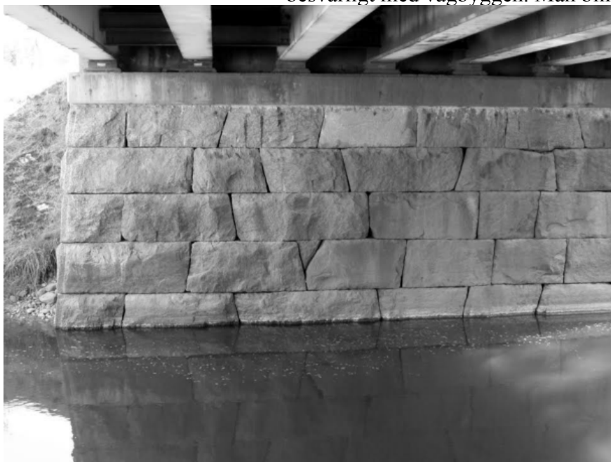
Det välbyggda brofundamentet