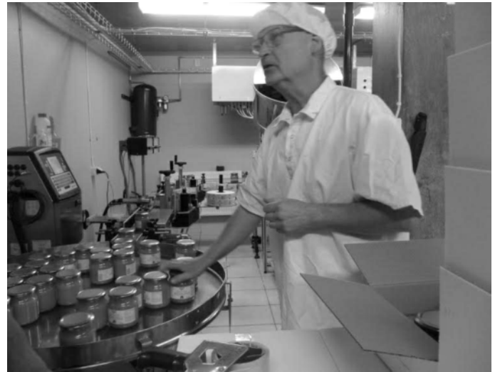
Tappning i burkar