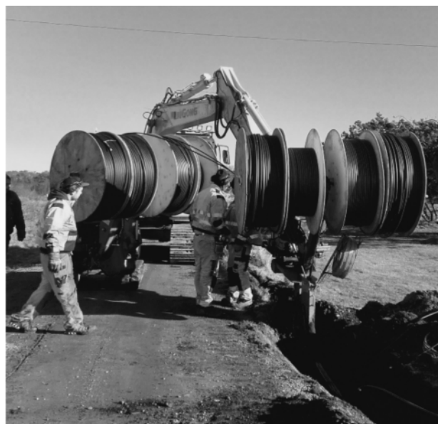
Här plöjs åtta slangar samtidigt.