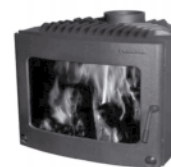
Braskaminer & Spisistatser