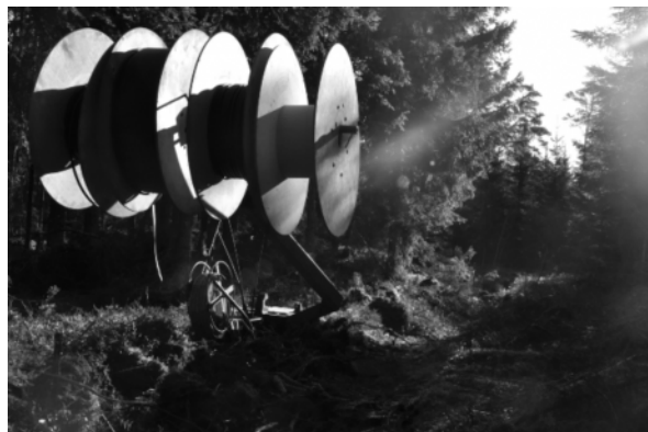
När arbete avbyts kopplas trummorna bort