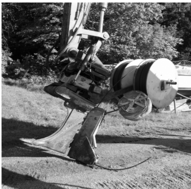
Kabelplogen, maxdjup cirka 90 centimeter