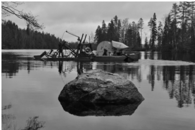
Sjökabel förläggs med specialbyggd båt

Dyvlanda Entreprenad har en modern och uppdaterad maskinpark där både larvmaskiner och hjulmaskiner finns tillgängliga för att tillgodose förläggning av kabel både utmed asfaltsväg, där larvmaskiner inte får framföras, och i åker- och skogsmark samt i trädgårdar. Idag finns här 12 stycken grävmaskiner och tre lastbilar. Att bara ha grävmaskiner för att bygga ett helt fibernät räcker dock inte. Man måste också kunna korsa asfaltsvägar. För att göra detta finns teknikerna att borra eller trycka sig under vägarna. År 2014 skaffade Dyvlanda Entreprenad sig en så kallad jordraketen, en grundomat, och kunde i samband med fiberplöjning även erbjuda kunden att binda ihop