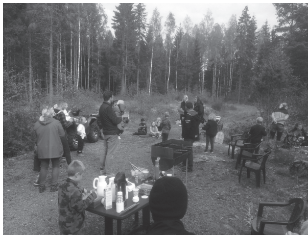
Samling vid grillen