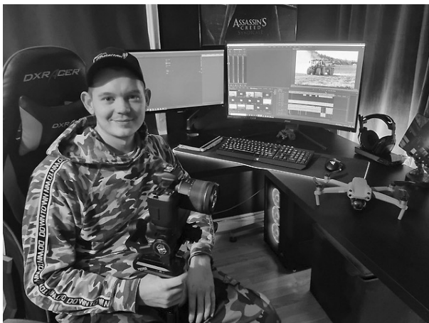
Samuel i multimediamiljö

ändock trygga med att de producerar mat, som allmänheten i stort är nöjd med; de kritiska är inte så många, även om de får stort utrymme i media. Hos dem finns framtidstro, även om klimatförändringar är faktorer som kan påverka det framtida jordbruket. De tror att företaget även i framtiden kommer att ha mjölkproduktion som huvudinriktning, även om det finns lösa planer på att komplettera med köttproduktion. Kommer de att bygga för ännu fler kor i framtiden? Nja, inte som det känns nu; fast å andra sidan har man alltid sagt, att nu kan det inte bli större. När bröderna byggde första gången utökade man till 18 kor och då ansågs det som stort. Om framtiden vet vi så lite.