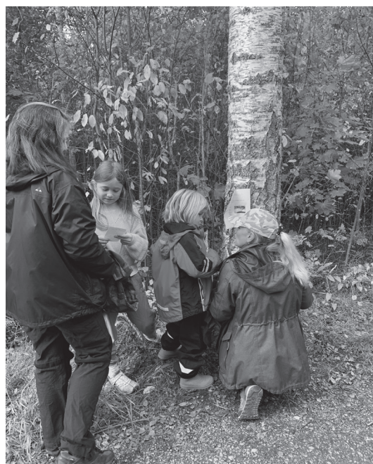
Kluriga frågor på tipspromenaden