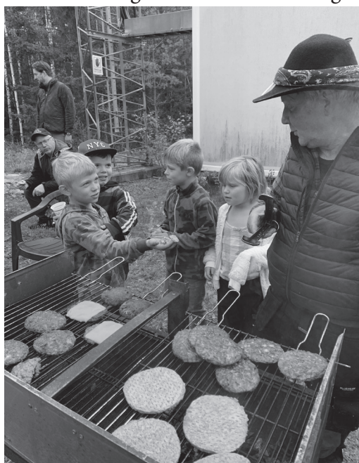
Barnen hittade kantareller